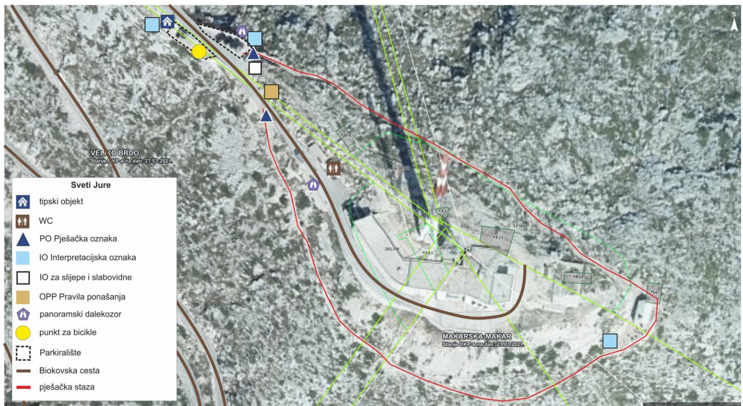
Slika 5. Sv. Jure – lokacija br. 5