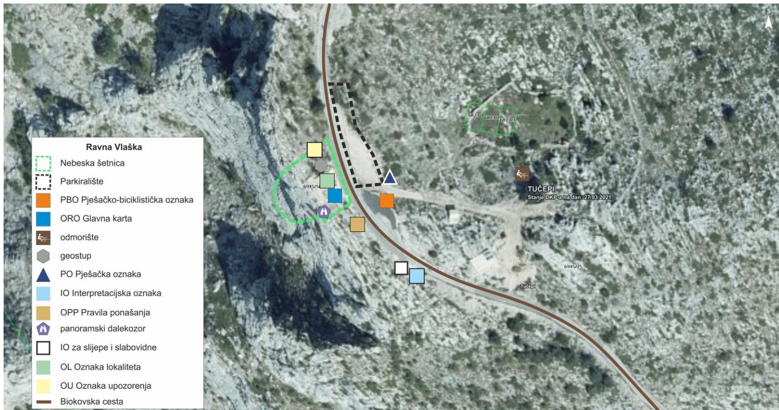
Slika 3. Ravna Vlaška – lokacija br. 3