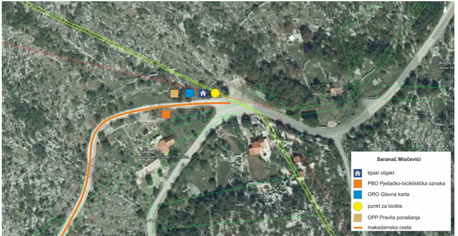
Slika 6. Saranač – Miočevići – lokacija br. 6