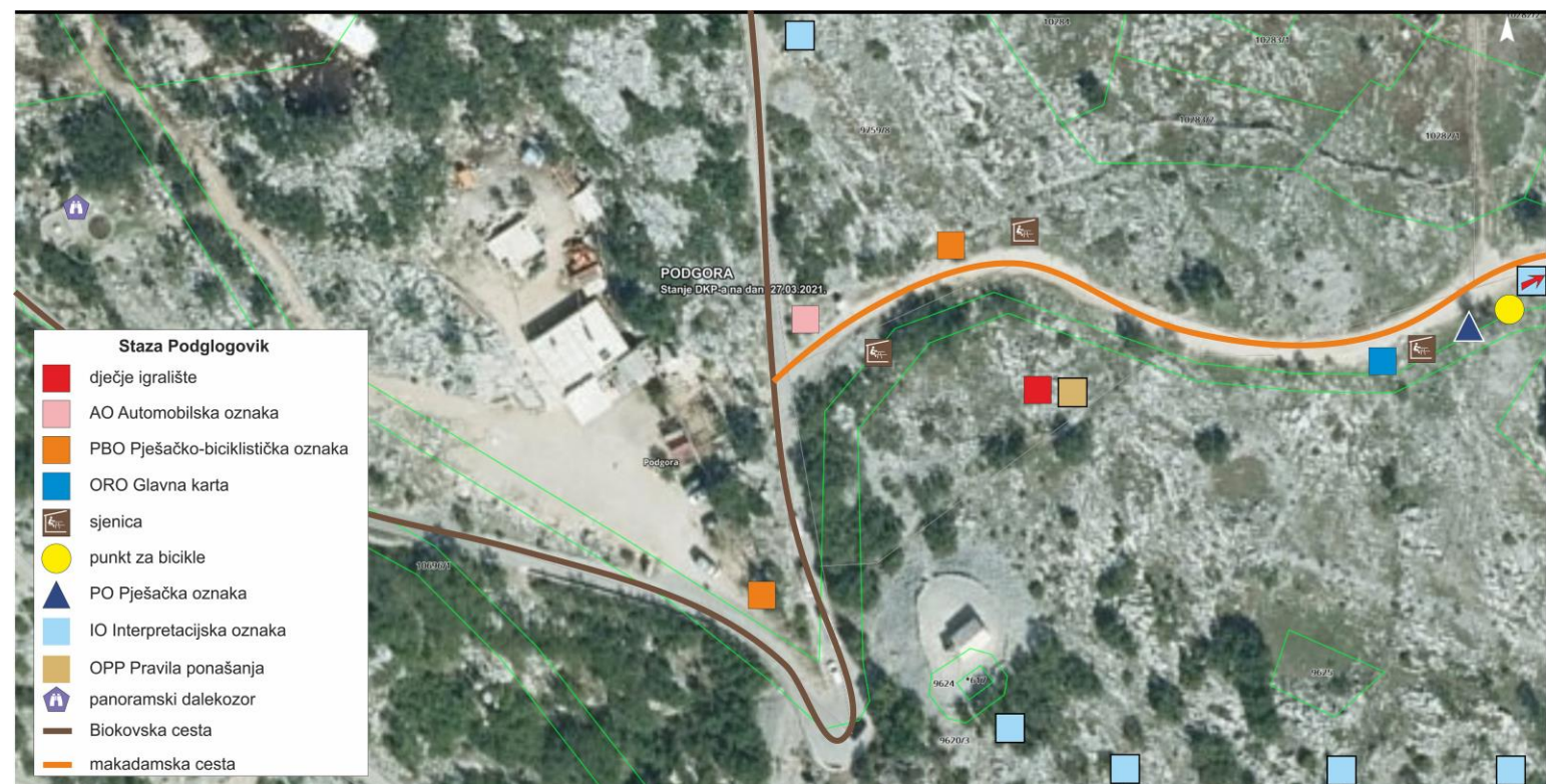
Slika 2. Staza – Podglogovik – lokacija br. 2