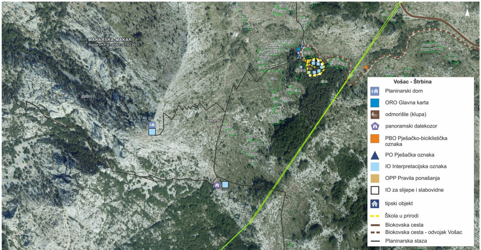
Slika 4A. Vošac - Štrbina (vidikovac i vrh Vošac) – lokacija br. 4